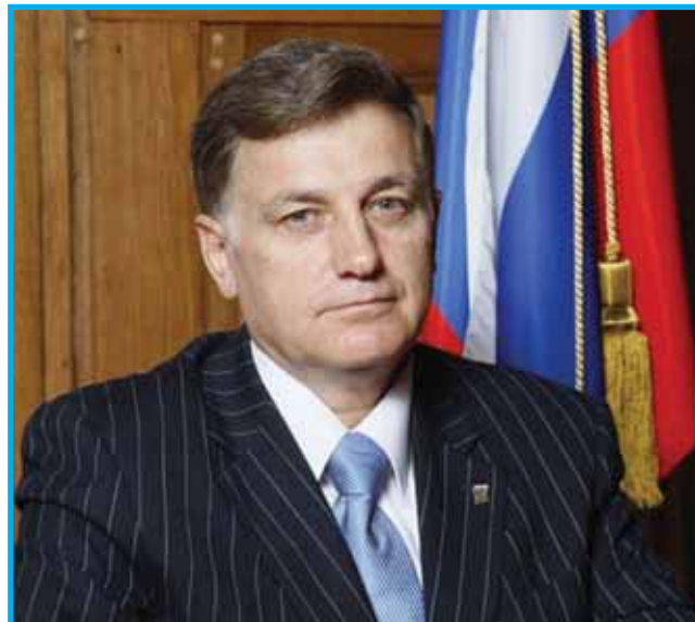
Секретарь Санкт-Петербургского регионального отделения Партии «Единая Россия», Председатель Законодательного Собрания Санкт-Петербурга Вячеслав Макаров

Пусть Новый год принесет исполнение всех Ваших желаний. Счастья Вам, дорогие друзья, здоровья и семейного благополучия!